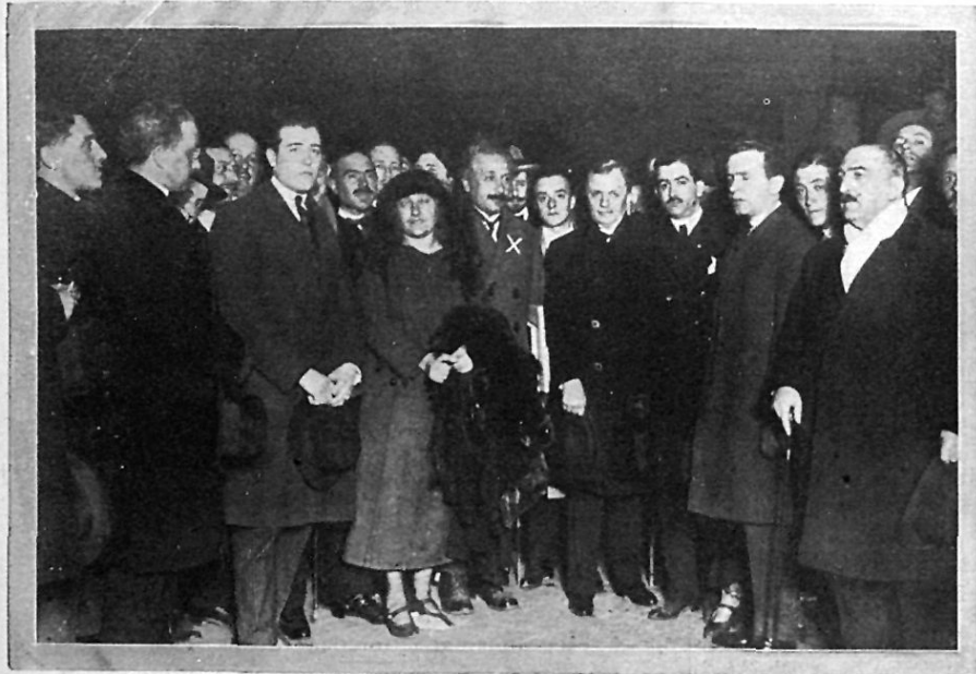
MADRID. EN LA ESTACION DEL MEDIODIA

UNDADO EN EL AÑO 1905 POR D. TORCUATO LUCA DE TENA